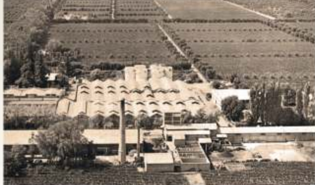
Bodegas y Viñedos Gargantini.

Fundó el club deportivo, campeón de fútbol en varias temporadas de la Liga local. Fue además uno de los fundadores del club más popular de Mendoza: “Independiente Rivadavia”.