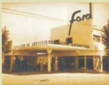
Tradicional esquina de "la Ford".