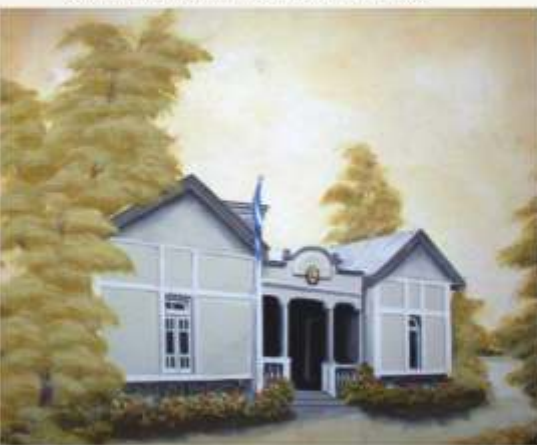
Casa Pippi (Antigua escuela del "Alto") - Pintura de "Carré" - Oscar Arancibia

La calle de los Cano y los Ozán, renovará su vigencia en 1.901 por la construcción del "puente viejo". Sobre su recorrido: la casa de los Pippi y al final, el alambique de Cardama. Otro hito de la zona "del alto" será la Escuela Nacional N° 21 "Formosa", creada el día 6 de agosto de 1.906. En el lugar que ocupó el edificio de la escuela, existían altos médanos de arena, motivo por el cual hasta hoy, le llaman la "escuela del alto".