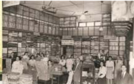
Tienda "La Fama", década del 40

También se multiplicarán otros oficios, como el de carnicero y "achurero". Recordemos que el ganado llegaba por ferrocarril a Estación Rivadavia de Ingeniero Giagnoni, y desde allí debía ser arriado hasta los corrales de Rivadavia, para luego ser faenado en el nuevo "matadero municipal" inaugurado en 1.917.