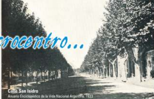
Calle San Isidro

Anuario Enciclopédico de la Vida Nacional Argentina, 1933