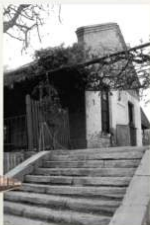
Antigua Estación de Santa María de Oro.